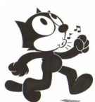
Félix le chat

8 Comment se nomment les personnages ci-dessous ?